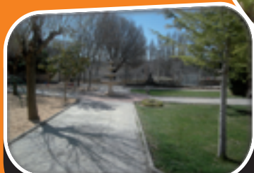
Parque El Pradillo