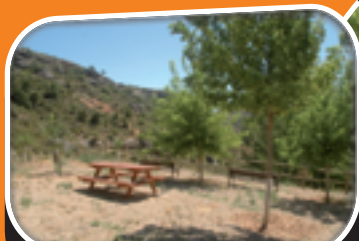
Merendero El Cenacho