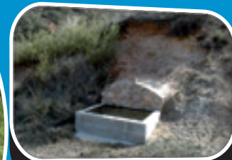
Fuente del Santo