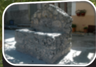
Fuente de Piedra