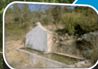
Fuente del Colmenar