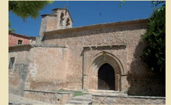
Iglesia de Ntra. Sra. de la Asunción