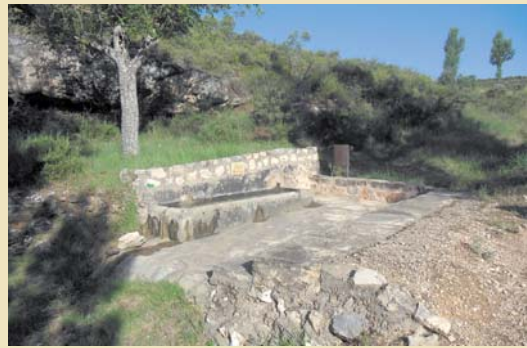
Fuente del Cenacho