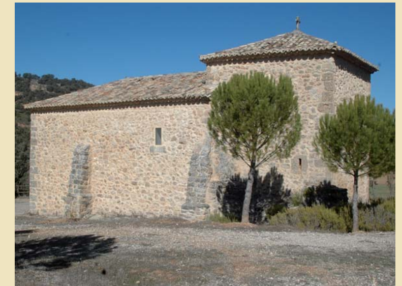
Ermita de San Bartolomé

De estas rutas de senderismo por su término municipal, podemos visitar la Covacha de la Mora y la Era Alta, partiendo desde la Fuente del Cenacho. Una buena pista nos lleva a la Fuente de Buempenilla y la Cañada Real Soriana, apta también para hacerla con bicicleta. "La Fuente del Colmenar" y el "Camino de las Tainas" son dos rutas que están señalizadas y balizadas y listas para recorrer.