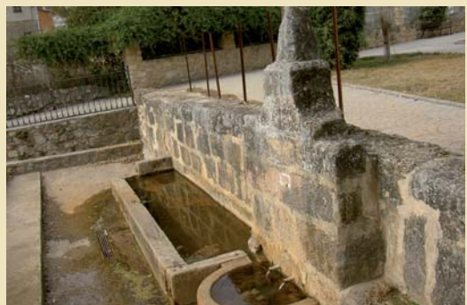
Fuente del Pradillo