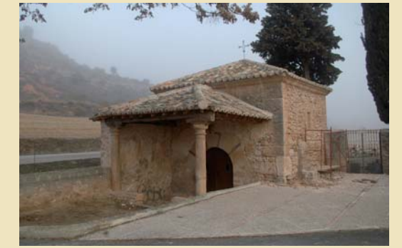
Ermita de San Roque