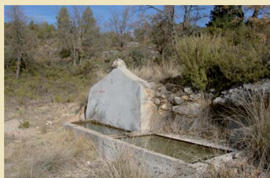
Fuente del Colmenar