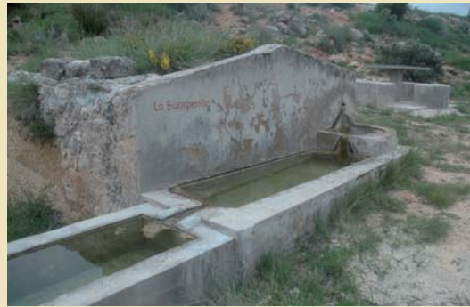
Fuente de la Buenpenilla